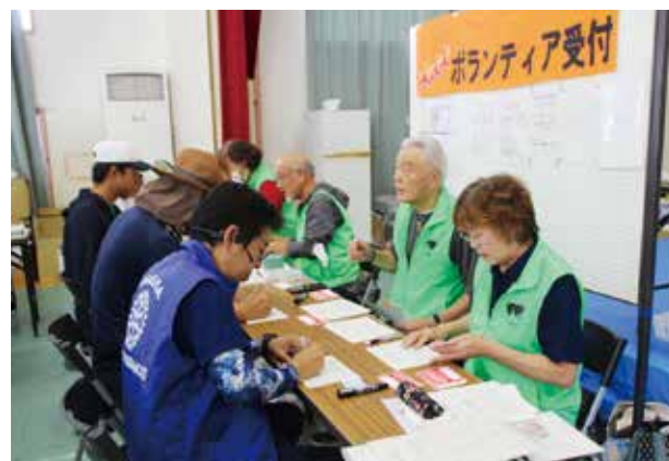
▲受付（本渡地区ボランティア連絡協議会）