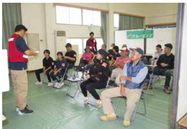
▲マッチングからグルーピングへ