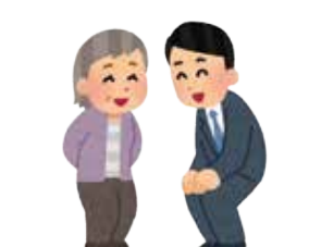
◆定期的な見守り・訪問