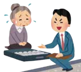
◆不利益な契約を取消