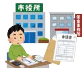
◆入院や入所、公的な 手続や書類の確認