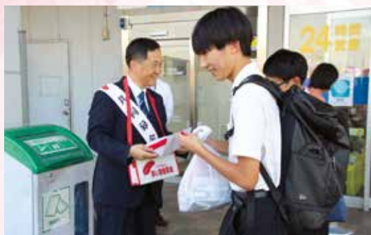
▲伝達式終了後、市内各地のスーパーで街頭募金を実施