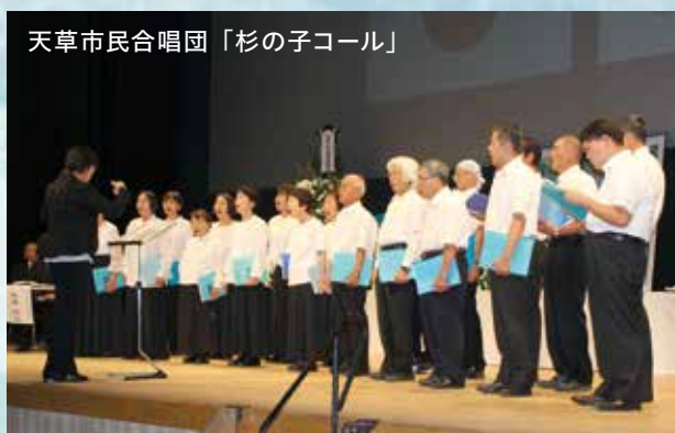
天草市民合唱団「杉の子コール」