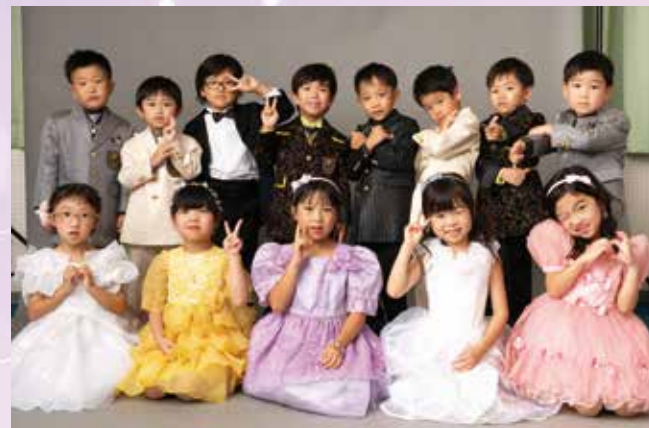
社会福祉法人 延慶会 延慶寺保育園 園児の皆さん