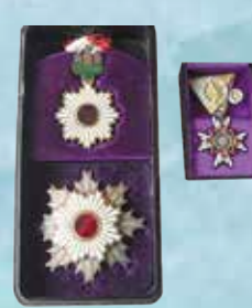
右上：瑞宝章 左上：旭日章 左下：旭日大綬章