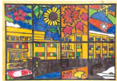
高等部2年生全員 『「Amakusa crystal」 ～Minnano Omoide Sakuhin～』